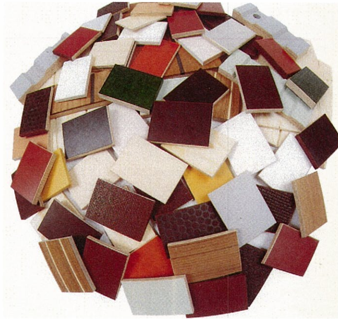
種類の豊富な Wisa 合板製品群