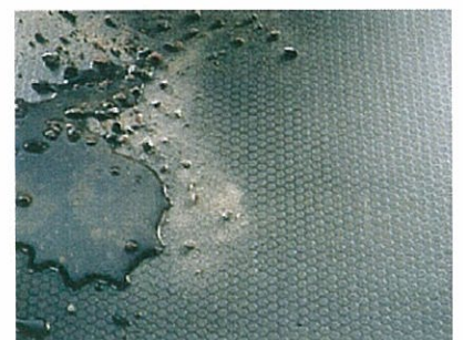
W i s a - H e x a

* ホワイトバーチ加工合板はこの他にも豊富な種類があり、各産業分野に広く利用されており ます。またスペシャルオーダーも可能ですので、お気軽にお問い合わせ下さい。