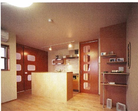
W i s a - F o r m