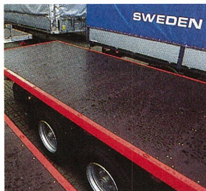
W i s a - W i r e